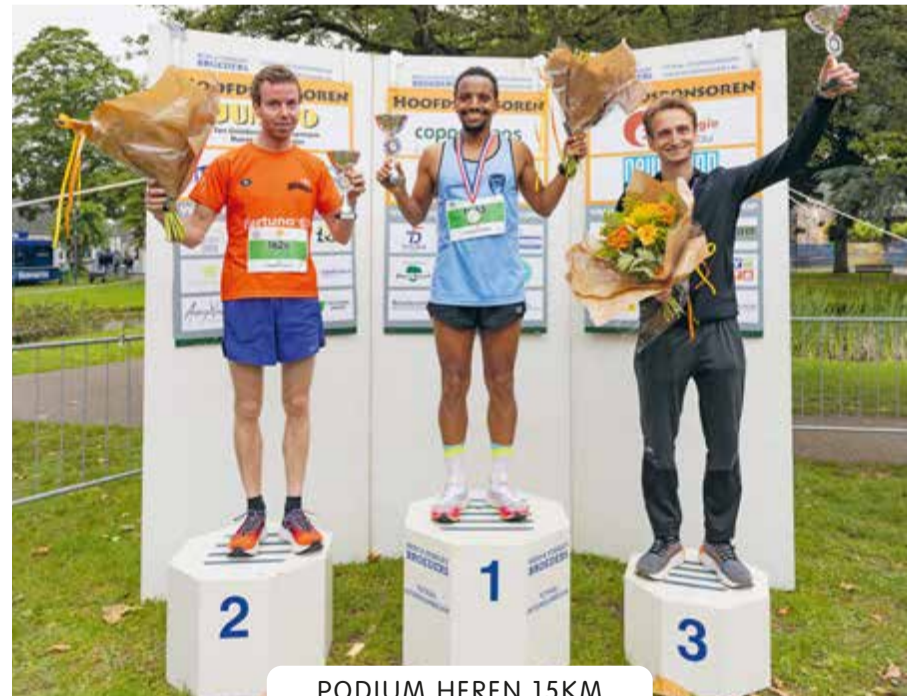
PODIUM HEREN 15KM